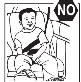
Derecha: Estos niños están usando el cinturón de seguridad en forma incorrecta. Esto puede causar lesiones.