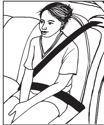
Arriba: Esta niña de 11 años está usando su cinturón de seguridad correctamente.

Si su carro sólo tiene cinturones de regazo en el asiento trasero, consulte los cuatro puntos más arriba para verificar el ajuste correcto. (No se puede usar un asiento elevado con cinturón de regazo solamente.)