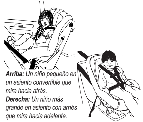
Arriba: Un niño pequeño en un asiento convertible que mira hacia atrás.

American Academy of Pediatrics (AAP): www.healthychildren.org (Vea la lista de productos de la AAP para buscar asientos de seguridad con límites de peso alto.)