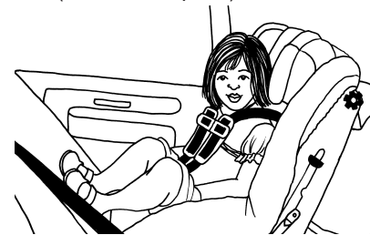
Asiento convertible para niños que pesan hasta 30 a 45 libras, que mira hacia atrás